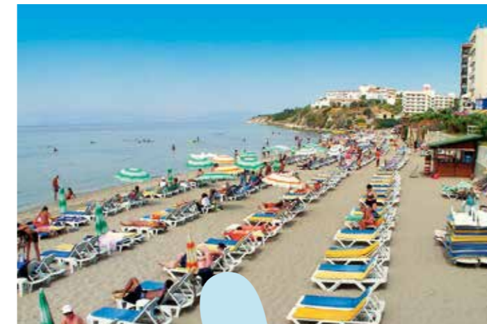
Överst: Efesos Till vänster: Stadsstranden i Kusadasi. Till höger: Fågelön

Det finns flera olika goda restauranger i Kusadasi, speciellt i gamla stan. Besök till exempel Restaurant Erzincan, en av Kusadasis flera charmiga, små turkiska restauranger. Vid marinan finns massor av fina restauranger, många av dem med fantastiska fisk- och skaldjursrätter. Den så kallade Bar Street i gamla stan är berömd för sitt livfulla nattliv. Här finns flera diskotek som har öppet långt in på natten. I marinan spelas ofta live musik på flera av restaurangerna och barena.