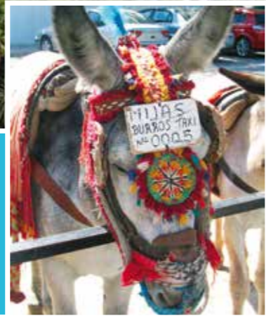
Överst: Malaga Vänster: Åsnetaxi i Mijas Nederst: Gibraltar

Årets stora nyhet är att vi börjat med All Inclusive-resor även till härliga Costa del Sol. Att komma till Spaniens solkust innebär att få se vackra landskap, smaka utsökt mat och att träffa den tillmötesgående lokalbefolkningen. Du kan också upptäcka ett rikt kulturellt arv, fantastiska stränder och charmiga landsbygder.