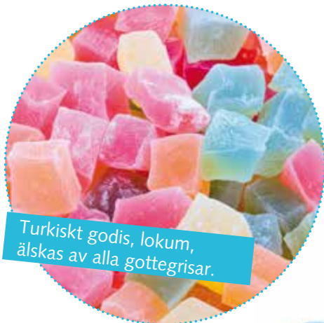
Turkiskt godis, lokum, älskas av alla gottegrisar.

Här har vi samlat ett urval av de bästa souvenirer som du hittar överallt i Turkiet. Kontakta oss guider för att höra närmre om de bästa butikerna och marknaderna.