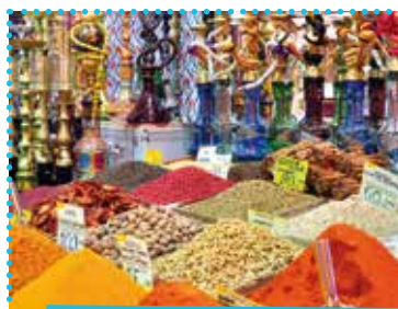
Ta med dig smaken av Turkiet hem! Köp spännande kryddor på den lokala marknaden.