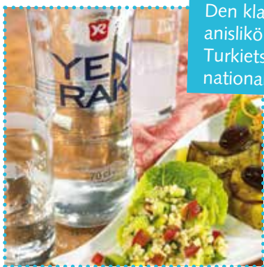
Den klassiska turkiska anislikören, raki, är Turkiets officiella nationaldryck.