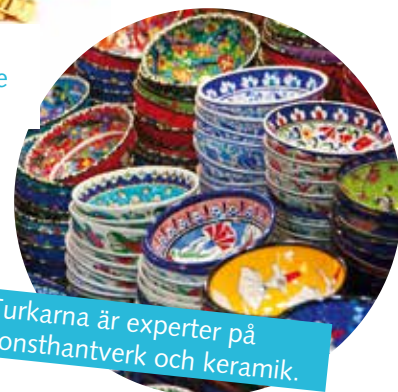
Turkarna är experter på konsthantverk och keramik.

Priset på smycken är ofta mycket lågt i Turkiet, då de är billigare att tillverka här.