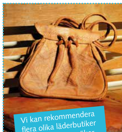
Vi kan rekommendera flera olika läderbutiker där du kan vara säker på att få hög kvalitet till låga priser.

I Turkiet får du låga priser och snabb service när du handlar glasögon, solglasögon och kontaktlinser.