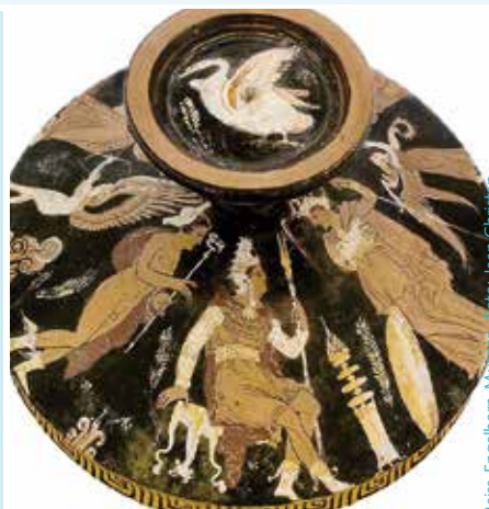
Reiss-Engelhorn-Museum, Foto: Jean Christen

Vi känner först och främst till Prins Paris från grekiska hjälteeposen Iliaden som förmodas ha utspelat sig kring år 700 f.Kr. Iliaden handlar om ett av världshistoriens mest kända krig, det trojanska kriget, som utspelades framför byn Troja vid Hellespont ca 1250 f.Kr. Då Prins Paris förde bort den vackra Helena från hennes grekiska fästman påbörjade grekerna en 10-årig belägring av Paris hemby Troja för att få tillbaka Helena. Trojas mäktiga murar föll dock inte förrän grekerna listade ut ett sätt att smugla in soldater i byn genom att gömma dem i buken på en enorm trähäst. Paris beskrivs som en usel krigare men förmådde ändå att ta livet av den grekiska hjälten Achilles genom att skjuta en pil genom hans häl. Arkeologer tycker sig ha lokaliserat det historiska Troja i nordvästliga Turkiet.