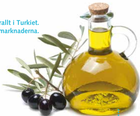
Olivolja av hög kvalitet hittar du bl.a. på de lokala marknaderna.